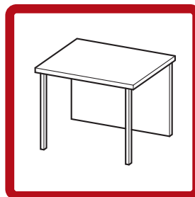
Figure 1 : Exemple d'abri fermé acceptable